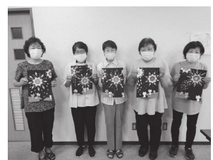
▲女性部の折紙教室