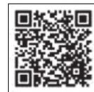
甲賀広域行政組合ホームページ

<適応火災が「文字」で「普通・油・電気」と表示されていたら「旧規格」の消火器です。>