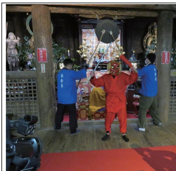
赤鬼（撮影日：2025. 1. 12）

少子化が進むなか、先人たちが村の安全と子どもの成長を祈願、祝福する村落の伝承行事として本市の無形民俗文化財として指定するにふさわしいと評価するものである。