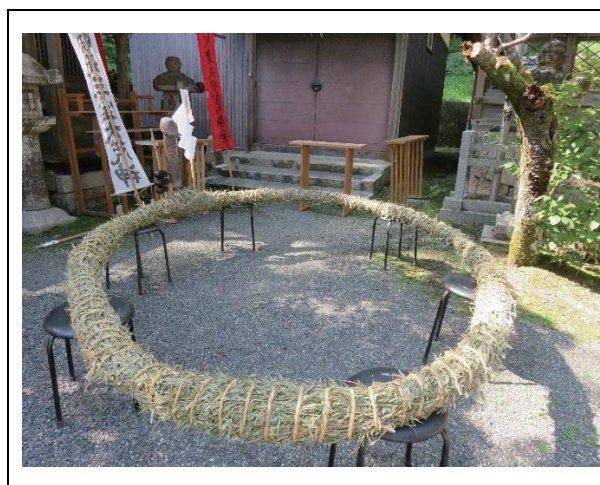
ボンノコ・ヘンノコ

火災から村の安全を守るのは勿論のこと、不特定多数の人々が往来する街道の沿いの村々にとって疫病退散もまた切実なものであった。多産や豊穰の力を持つと信じられる性器の形状を模したボンノコ・ヘンノコを子どもたちが担ぎ、旧東海道を練り歩く当祭礼は街道に残る厄除けの貴重な祭礼行事の一つであり、本市の無形民俗文化財として指定するにふさわしいと評価するものである。