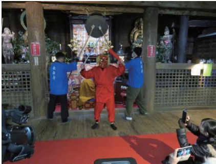
東寺の鬼走り行事