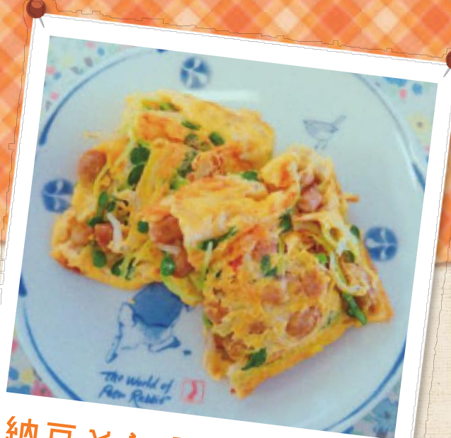
納豆としらすの卵焼き