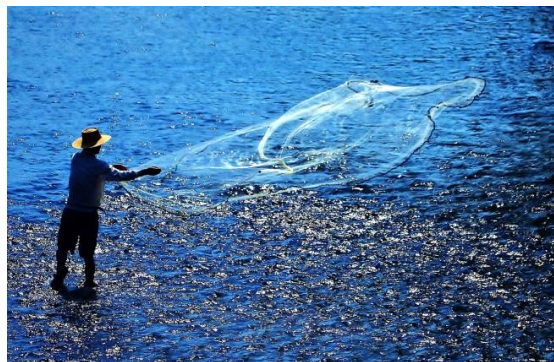
きんしょう 「やすがわ の とあみ」