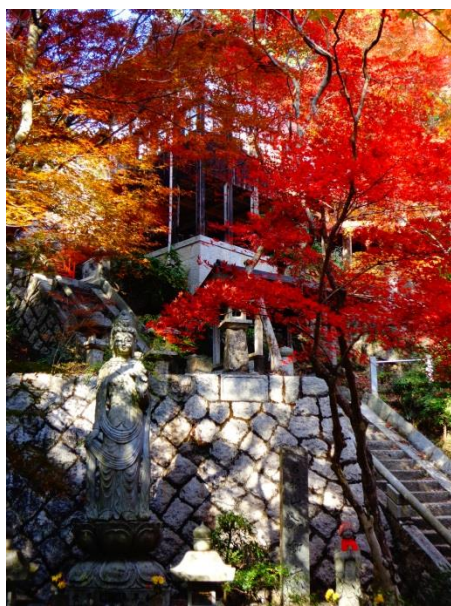
どうしょう 「あきの ふどうじ」

「湖南省八景2014」フォトコンテストの 入賞作品が決められました。四季折々の市内 の風景が選ばれました。