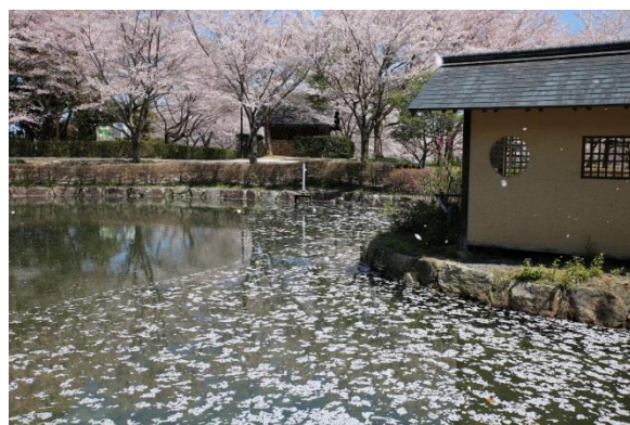
ぎんしょう 「さとの はる」

「湖南省八景2014」フォトコンテストの 入賞作品が決められました。四季折々の市内 の風景が選ばれました。