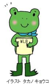
イラスト タカノキョウコ