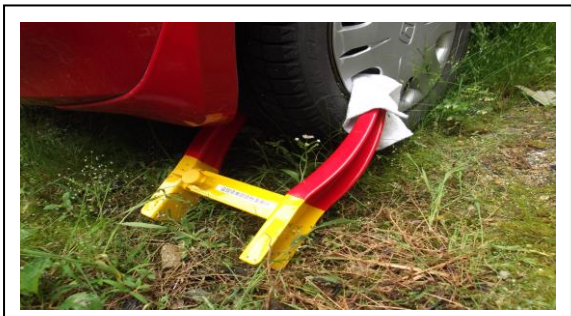
くるまのタイヤロック