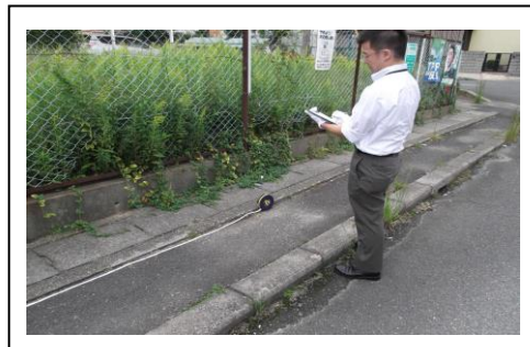
いえや土地の調査

11月と12月は、一斉に差押えをする月です。給料や預貯金の差押えをしますの で、税金の払い忘れがないか確かめてください。