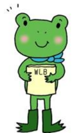
イラスト タカノキョウコ