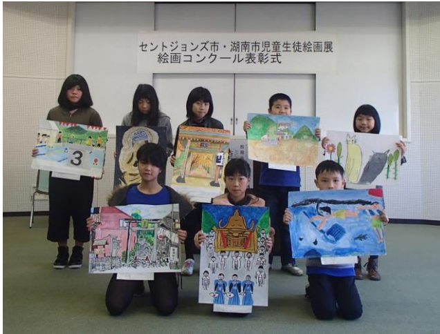
ひょうしょう しき ようす 表彰 式 の 様子

ことし 今年 も アメリカ にある セント ジョンズ市 と 湖南省 の 子どもたちの 絵 を 2月 4日(日曜日) まで 甲西 図書館 で 見る こと が できます。 こなん しな い しょうがっこう ちゅうがっこう こ かいが てん え なか てん えら 湖南省 市内 の 小学校 ・ 中学校 の 子どもたちが 描いた 183点 の 絵 の 中 から、9点 が 選ばれ、子どもたちが 教育長 から 表彰 状 と 賞品 を もらいました。