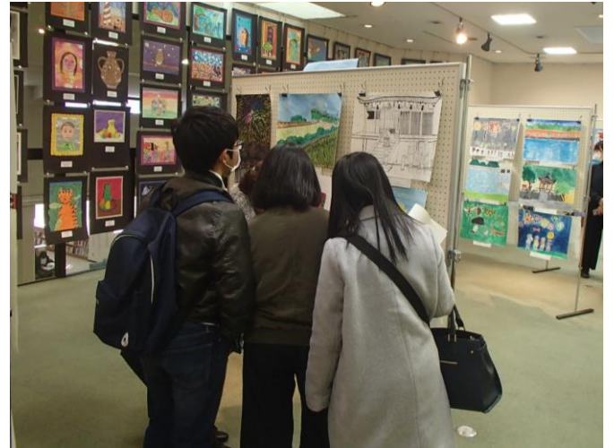
かいが てん ようす 絵画 展 の 様子