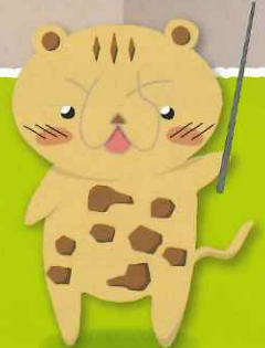
土地政策のイメージキャラクター とちーた