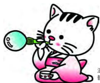
滋賀県「こんにゃん市」 観光大使 こにゃん®