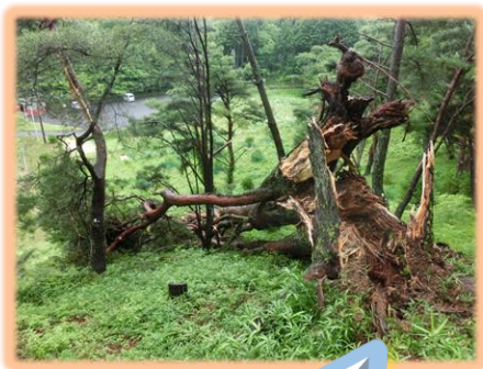
根本から折れた ウツクシマツ

ウツクシマツの成木が倒れた場合、周囲に大きな影響を与えることから、他のウツクシマツの状態も調査することを予定しています。