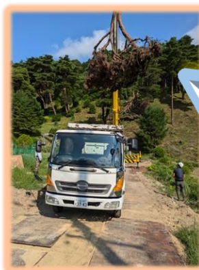
クレーン車を使って トラックへ積み込み