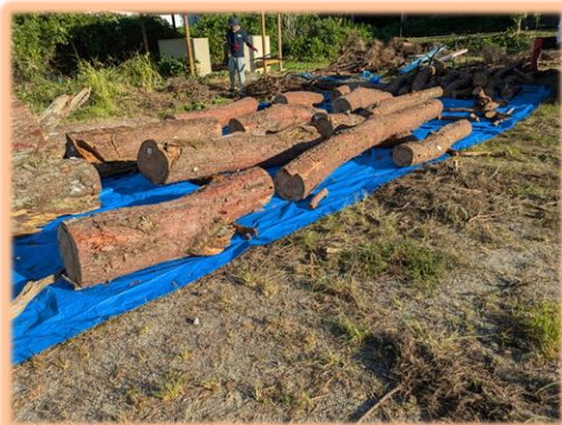
玉切りしたウツクシマツは並べて集積