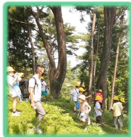
自生地内での 見学の様子