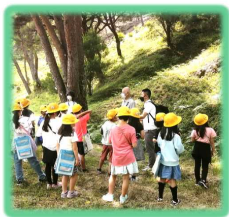
自生地の前で説明を 聞いている様子

短い時間での学習、見学でしたが、子どもたちが貴重な体験をできたと感じてくれていれば幸いです。