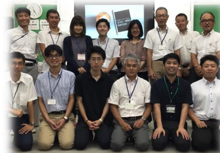
実践交流会 東京都足立区興本扇学園にて