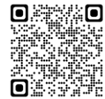
リーディングDXスクール事業について (文部科学省公式サイト)