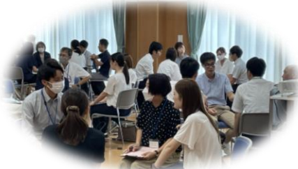
午後：中学校区別研修会