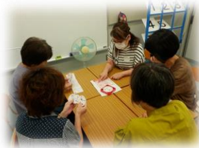
ことばの教室(特別支援)