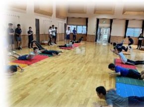
小学校体育実技講習会