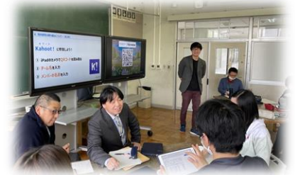
校内研修のようす