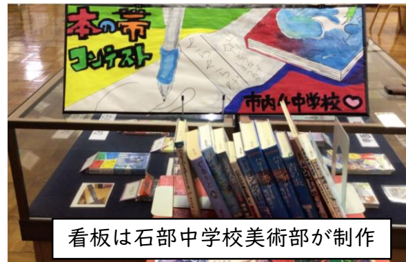
看板は石部中学校美術部が制作

4中学校の図書委員と有志が制作した本の帯コンテストが開催されました。各校で選考された優秀作品7点が、市内の書店や市立図書館の協力を得て展示されました。