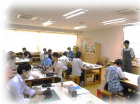
図画工作・美術科