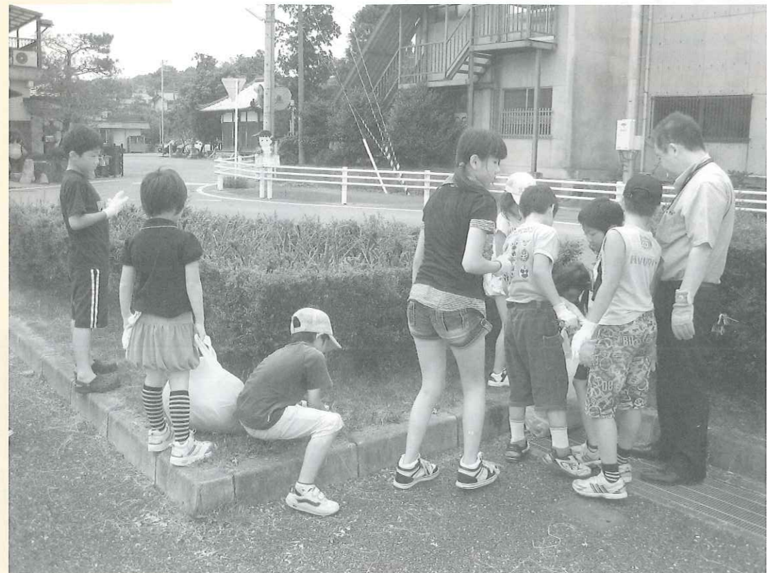
三雲青少年学区市民会議の1コマ