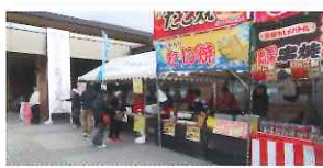
まちづくりフェスタ(中学生屋台2)