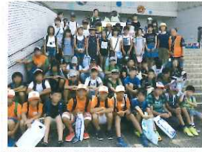
夏休みわくわく体験事業「名古屋港水族館」