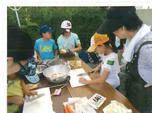
防災ディキャンプ