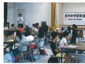
夏休み子ども学習教室