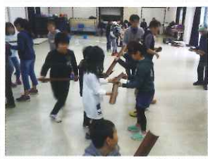
ふれあいレクリエーション