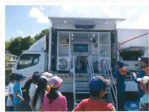
防災ディキャンプ