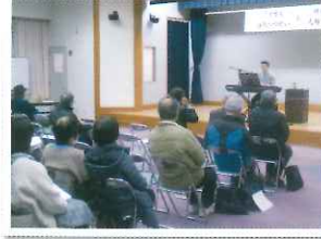
住民のつどい「人権セミナー」