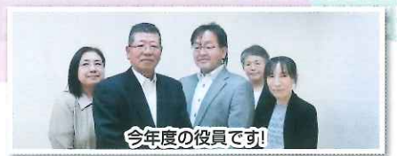
今年度の役員です!