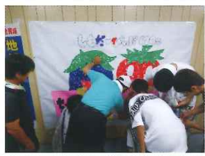
下田商工夏まつり「貼り絵であそぼう」