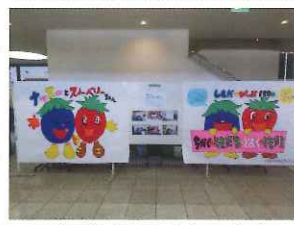
下田商工夏まつり「貼り絵であそぼう」