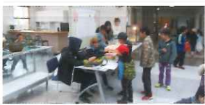
まちづくりフェスタ(小学生スタンブラリー)