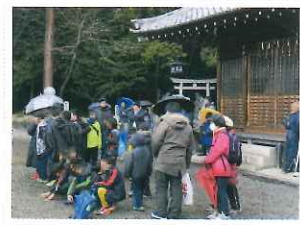
新春ウォーキング