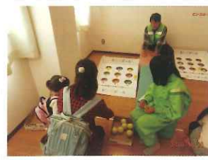
ハリキリンピック