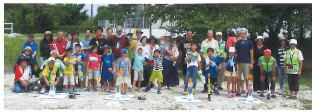
ペットボトルロケット大会