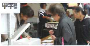
まちづくりフェスタ(中学生屋台1)