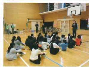
春休み自転車交通安全学習