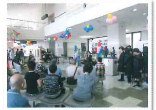
石部ふれあいまつり