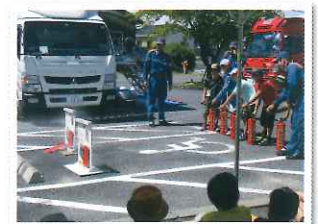
防災ディキャンプ