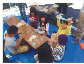
ふれあいまつり「スライム作り」