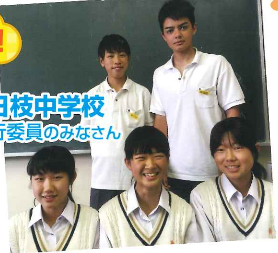
日枝中学校 実行委員のみなさん