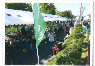
岩根まちづくりフェア