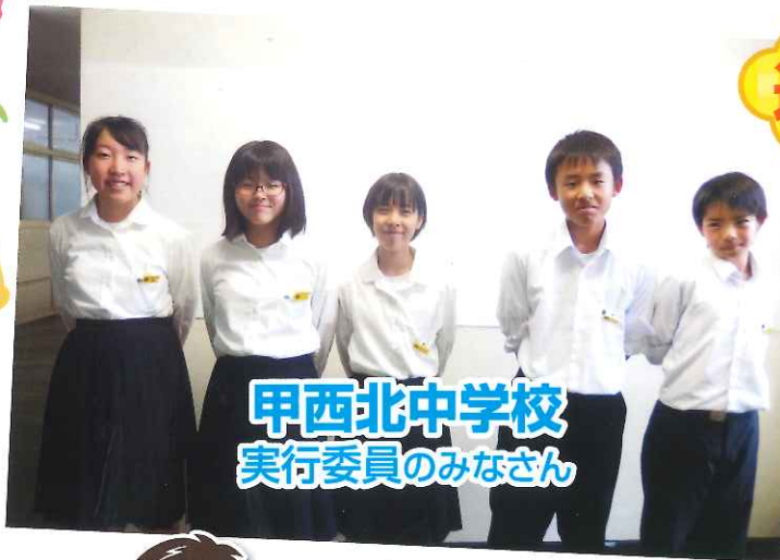
甲西北中学校 実行委員のみなさん