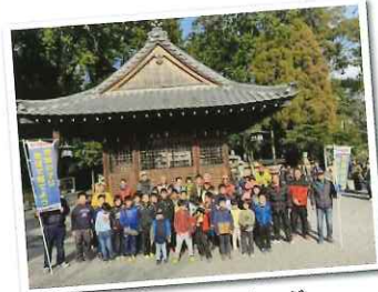
新春ウォーキング