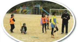
あつまれひがしっ子