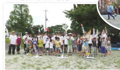
R1 ペットボトルロケット大会