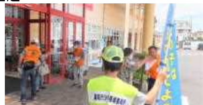
7月3日の街頭啓発活動の様子 市内5店舗で啓発活動を実施

学校が夏休みに入る7月を「青少年非行・被害防止強調月間」として、全国的に運動が展開されています。滋賀県では、冒頭の重点施策のほか、有害図書浄化活動、薬物乱用防止対策、再非行の防止、児童虐待防止の総合的な支援、いじめ、暴力行為等の問題行動への対応、関係機関と地域社会が一体となった補導・相談活動の推進を積極的に推進することとしています。