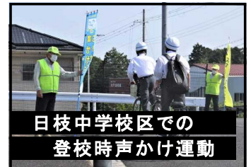
日枝中学校区での登校時声かけ運動

その中の一つに、登校時や下校時に中学生たちに声かけをする「愛の声かけ活動」があります。「おかえり」「ただいま」——そんな何気ない言葉のキャッチボールに子どもたちの笑顔が光ります。