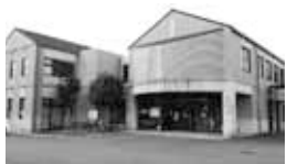
地域包括支援センターが入る保健センター

答 引き続き1カ所直営の地域包括支援センターで運営をしますが、現状の職員数では厳しいので、できればエリアごとに2チーム制での対応を検討していきます。