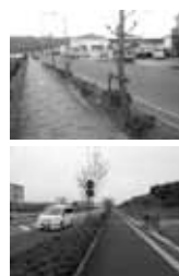
不ぞろい街路樹解消

定・施肥などを行っていません。低メンテナンスの樹木での整備と環境づくりが必要と認識していますが、樹木・植栽帯の改善にも費用が伴うため、すぐには難しい現状です。