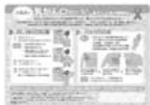
お風呂場に貼って使用する

答 自己検診の啓発物品として、集団検診時に月1回のセルフチェックの必要性が書かれたクリアファイルと一緒に自己検診記録表を配布。定期的な受診している市民のために、出来るだけ同じものが啓発物品として渡らないよう配慮するなど、今後も自己検診率が高まるよう啓発の仕