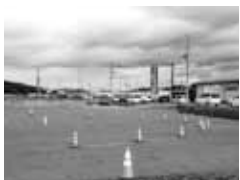
[ここぴあ交差点付近]

答 関係団体へ補助金交付し、支援しています。市体育協会です。今年度新たに「スポーツフェスティバル」を開催して頂きました。