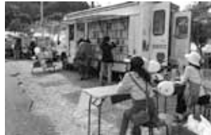
移動図書館マツゾウくん

答 図書館にくることが難しい人や、本に親しむ家庭環境にない子どもたちなどが、本に接する機会を確保するために、集える場としての新たな地域サービスを図ります。