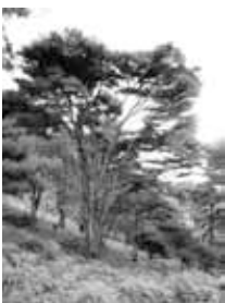
ウックシマツ自生地

問 身の丈に合った国体に 2024年滋賀国体に向け施設新設に600億円の経費が見込まれています。県に対し既存施設の活用と簡素化への要望と湖南省の関わりは。 答 首長会でも多額の経費に懸念、改善を求めていました。湖南省は剣道競技を総合体育館で県の予算は、3千万円、湖南省の予算は、2千万円です。 問 滋賀県教育委員会は、平成28年度4855件のいじめの認知件数を公表しています。湖南省の状況について、問題行動・不登校調査でSNSによる中傷、嫌がらせの認知件数は、不登校の増加の主な要因と対応策について。 答 いじめ件数は63件、不登校などについては、きめ細やかな対応と評価を受けています。また自尊心を育む教育