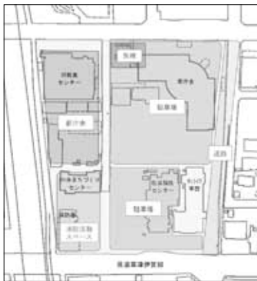
【新庁舎等の配置計画】

うち、行政機能として教育委員会および人権擁護課の2部署を新庁舎に集約する計画です。西庁舎や周辺施設については、新庁舎の完成に合わせて公共施設等マネジメント推進委員会を来年度に立ち上げ、慎重に検討していきます。