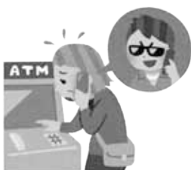
特殊詐欺・ネット被害に注意!

答 平成30年4月に設立し、事業展開していく予定です。その主な活動は、空き家の発生予防、制御と空き家の所有者の意向による維持管理、修繕、除却、利活用などと空き家バンクにおいて空き家所有者と利用希望者とのマッチングを行っていく活動です。 その他 孫育てハンドブックの作成を! を取り上げさせていたいただきました。