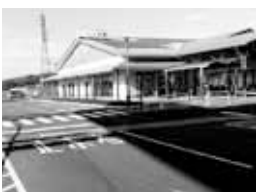
市民産業交流促進施設「ここびあ」

街活性化事業助成金・商店街振興に関する補助金など、商工会とともに小規模商店や商店街振興に関する様々な制度を活用し、その競争力強化や活性化を図る支援策を考えています。