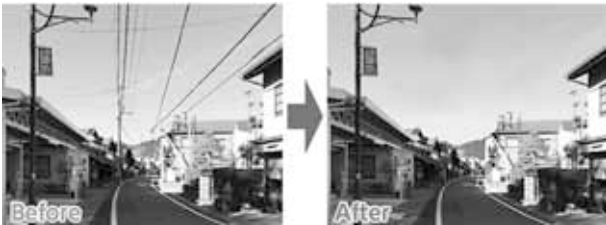
無電柱化にすると、とても素敵な街になります。

答 側溝施設など構造物に損傷があり十分に機能発揮できていない箇所については確認後、修繕の必要があれば対応します。想像以上の降雨時には、各家庭や地域で普段から確認や備えの必要性があると認識していただきたいと思います。