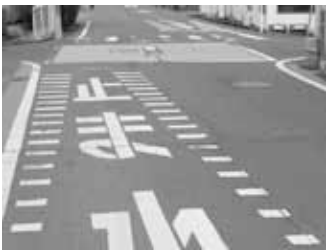
様々な工夫が必要な交差点

答 石部小学校校区に2カ所・三雲小学校区に5カ所把握しており、湖南市通学路交通安全プログラムにより、通学路の危険箇所改善に向けて進めております。危険な交差点につきましては、地権者や地元協力が得られるところから、見通しの確保に向けた取り組みを進めていきたいと考えております。