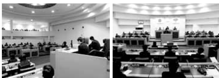
議場で行われた甲西中議会

その他の取り組みに ついては、多くの意見 が出ている中から、優 先する事項を議論して いきます。