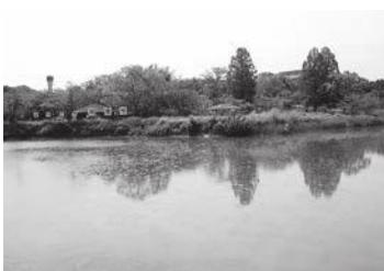
にごり池自然公園

問 災害を想定した浸水対策の検討は。 答 平成28年に湖南市雨水計画を策定しました。市民の安心安全確保のため、石部の村井川など毎年計画的に雨水策工事を実施しています。