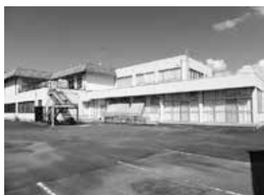
石部学童保育所 (石部保健センター内)

安心安全な施設環境の構築と早急に石部第2学童保育所の安全な場所への移動を願います。