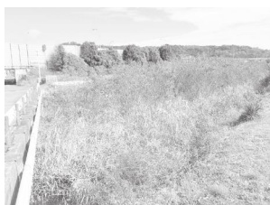
草木の生い茂る大山川

答 河川管理者である 県に情報を提供し、現 場確認を依頼します。 問 大山池の水位が高 く、あふれる危険があ り、対策が必要では。 答 平成30年に導水路 を整備してから水があ ふれる危険性は改善し ました。余水吐の切り 下げは水利権者の同意 が必要であり、協議中 です。 問 大山池の擁壁や地 面が削られています。 どのように取り組んで いくのか。 答 大山池の堤体の一 部は、市道の法面を兼 ねているので、状況を 確認し、県にも情報を 提供します。