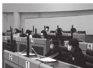
▲みなさん喜んで議席に座っていました

説明のあとは質問コーナー。実際の議会のように挙手をして議長に発言の許可を求め、指名を受けたあと、質問者席に移動して質問を行いました。