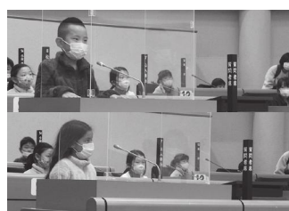
▲みなさん積極的に質問をしてくれました

これからの湖南省を担う子どもたちに市議会について知ってもらうよい機会となりました。この体験が湖南省議会に興味を持ち、ひいては湖南省に対する愛着を深めてもらうことにつながればと願っています。 子どもたちの見学をお待ちしています。