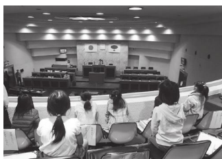
▲傍聴席って高い!! 身の乗り出しに注意です

三雲小学校の3年生77人が10月20日、市役所の東庁舎を訪問し、庁内見学を行いました。今回の訪問は社会科の授業の一環として市役所の仕事について学習するために実施されたものです。