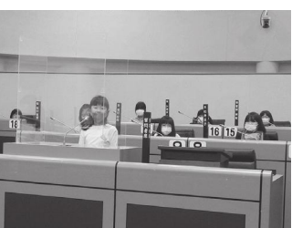
▲挙手をして質問者席へ

その後、職員から議場や、議会の仕組み・役割についての説明を受け、みなさん熱心に聞き入っていました。