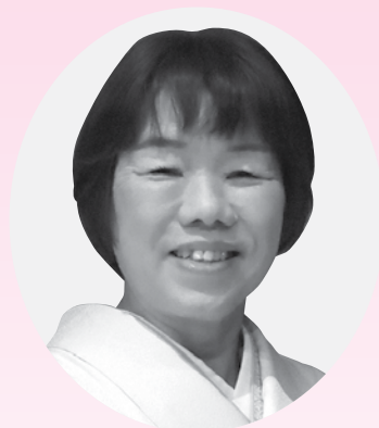
第14代湖南省議会議長 細 川 ゆかり