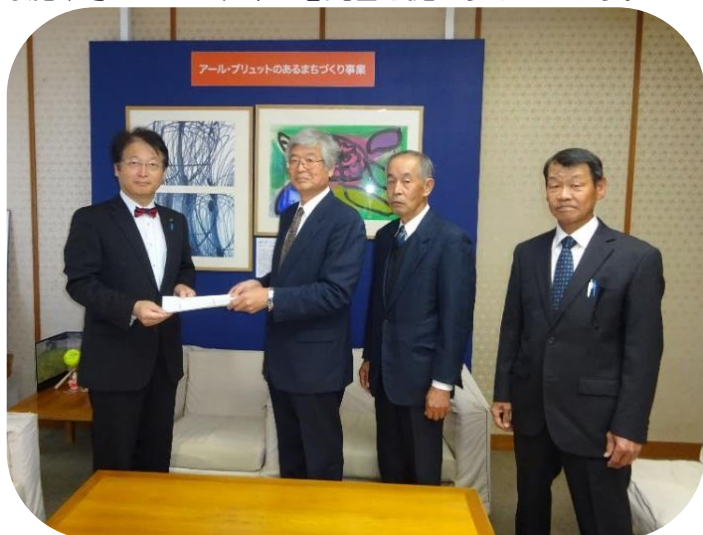
▲市長に意見書を提出

平成30年10月30日、「平成31年度湖南省農地等利用最適化推進施策に関する意見書」を湖南省長に提出しました。これは農業委員会法の規定に基づき、農地等利用の最適化を効率的かつ効果的に実施するための必要な施策等について、市に意見書を提出するものです。