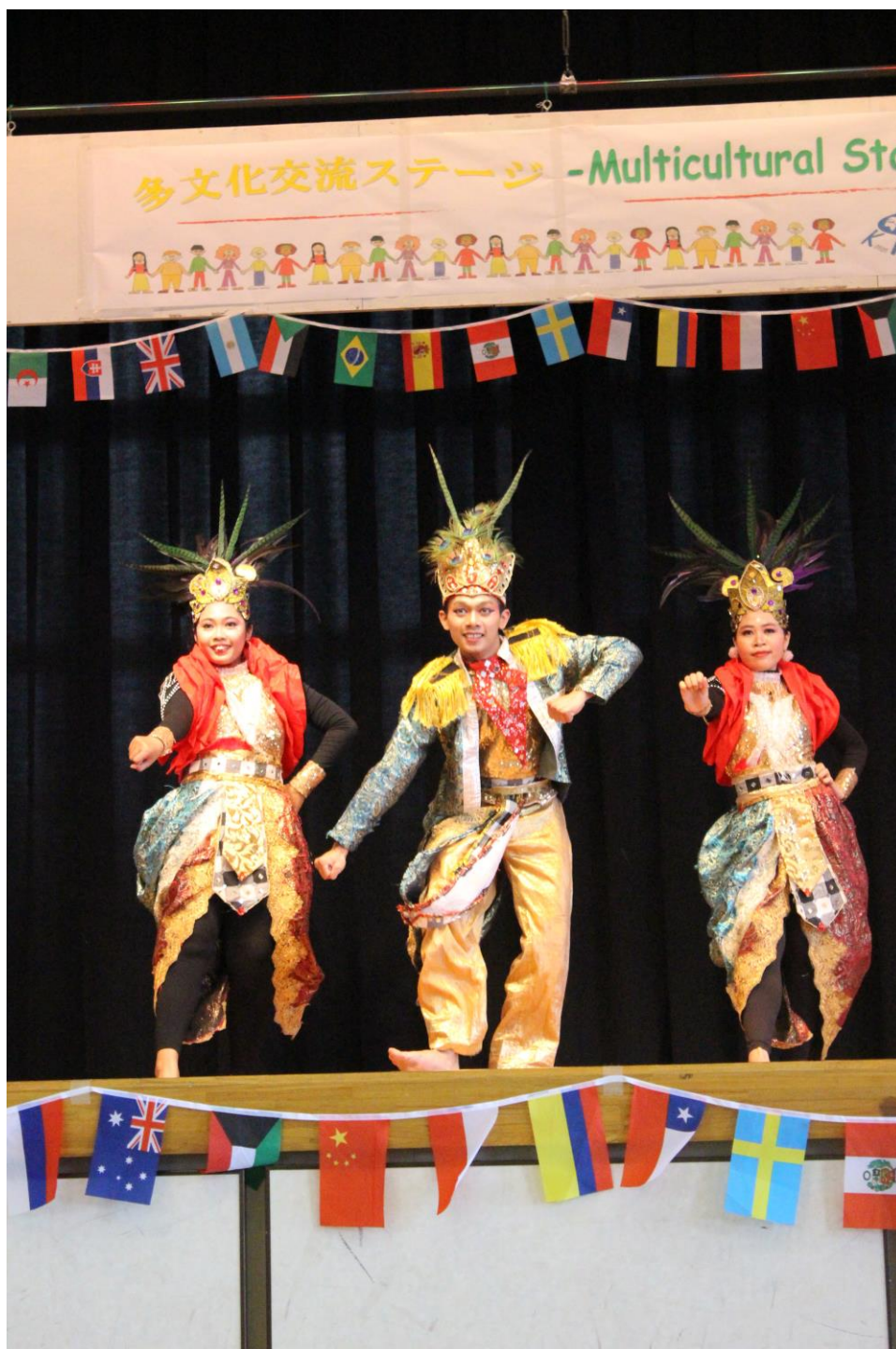
こんげつ ひょうし 今月の表紙 おど インドネシアの踊り EKA KAPT I DANCE

こなんし 湖南市 ホームページ も みて ください: http://www.city.konan.shiga.jp/