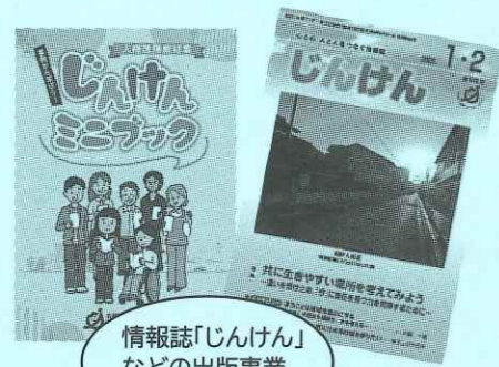
情報誌「じんけん」 などの出版事業