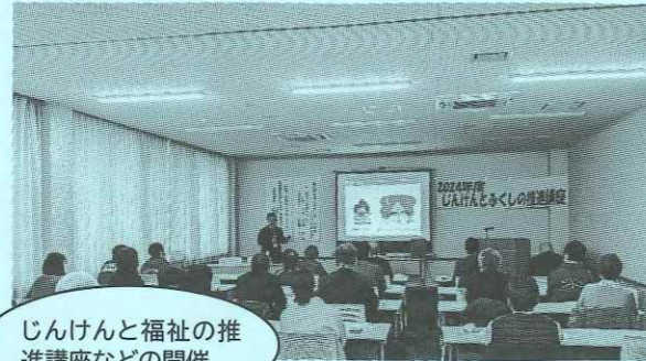
じんけんと福祉の推 進講座などの開催