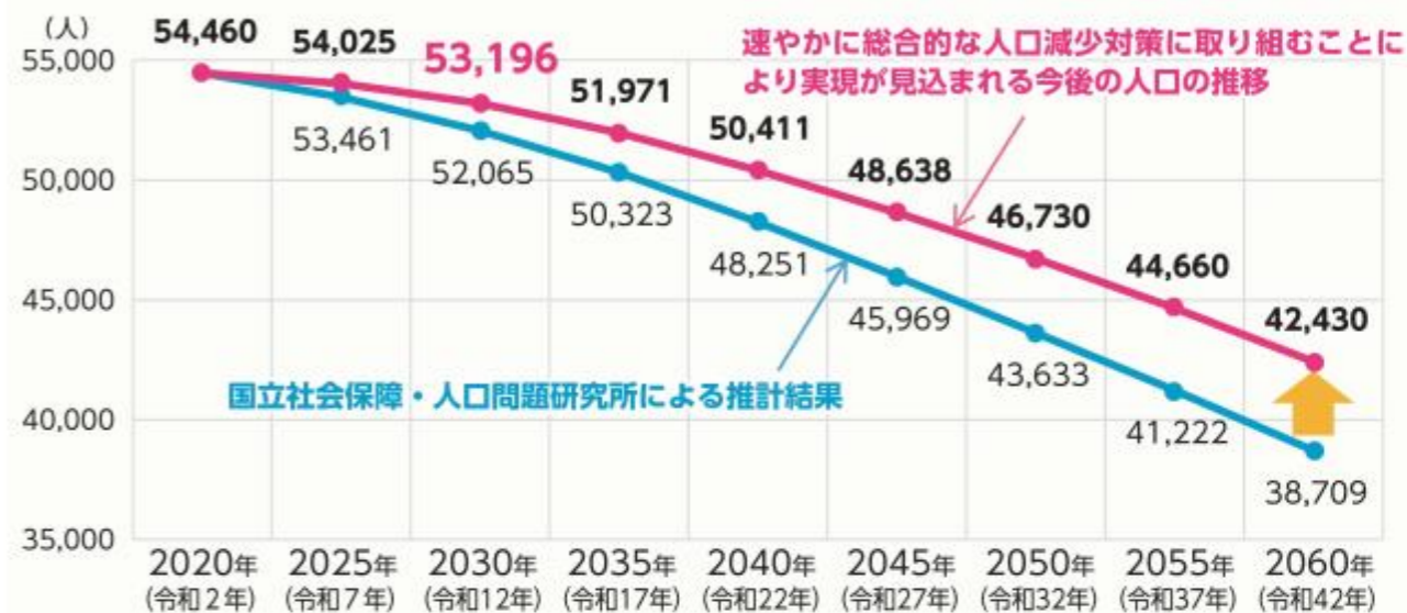
図 湖南市の将来人口の見通しと目標