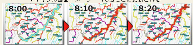
▼時系列情報（明日までの警報等の見通し）