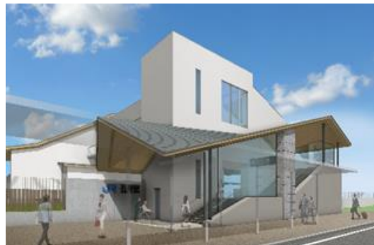
Futura saída norte da estação de shibe

Informações: Toshi Seisaku-ka, prédio (higashi chousha)