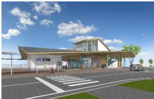
Futura saída sul da Estação de Ishibe

2- Período: 1º de outubro (sex) até 22 de outubro (sex) de 2021.